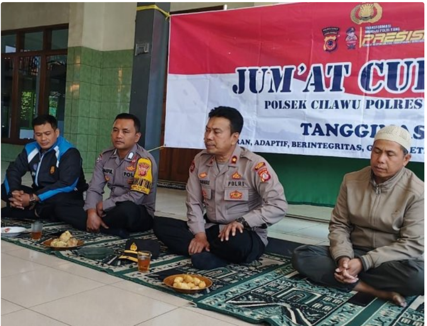
Kapolsek Cilawu mendengarkan curhatan warga